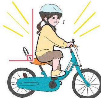
TOPの自転車は乗りやすい!!