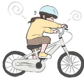
従来型の園床フレーム