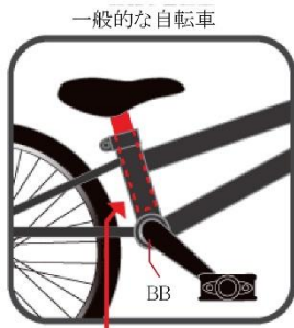
一般的な自転車 サドルの伸びしろはこれ以上長くできない。

成長とともにサドルを伸ばしても腕が窮屈にならず、乗りやすい姿勢を保つことができることから、最長5年長く乗れる自転車を実現しました。